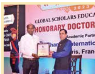
Rashtrapita National Award