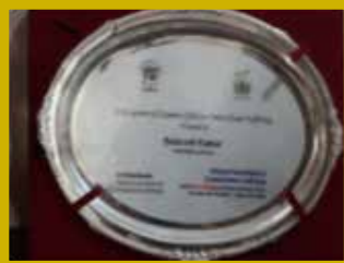
National Commission for Protection of Child Rights