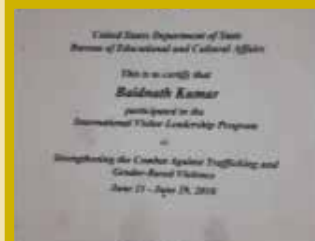
International Visitors Leadership award, U.S.A