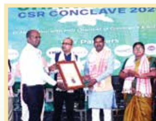
Change Maker Award